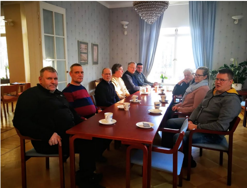
Hallituksen jäsenet Pyhäjärvi-instituutissa.