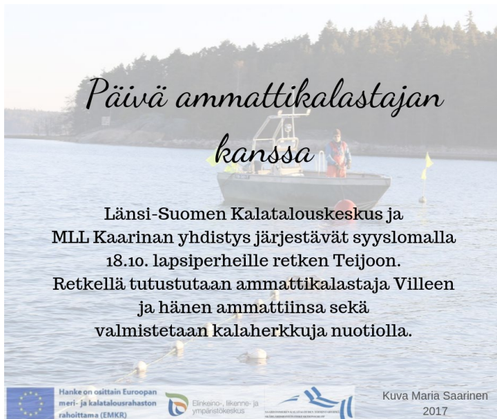
KUVA 1. AMMATTIKALASTUS TUTUKSI RETKEN MAINOS

Yhteistyötahoina hankkeessa on ammattiopisto Livia, Mannerheimin lastensuojeluliitto (MLL) ja Maa- ja Kotitalousnaiset. Kurssit järjestettiin oppilaitosten keittiöissä, sekä ulkona.