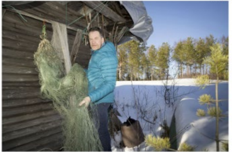
Oikea Tiira perheen kalastusalueensa osassa lämpöä matalla. Koskiriiton kalastusalueen oikeus riistääsi nousuun ohi, vaha kalastajien silmiä kiinnittämättä.

Viranomaiset katsovat, että ilman kiinteistörekisterimerkintää koskiriiton kalastusoikeus on henkilökohtainen. Professori pitää tulkintaa vääränä.