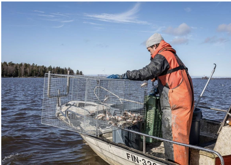
Katiskan koentaa.